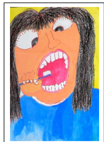
銀水小 志水 日花里

さまざまな色のクレヨンと水彩絵の具を使い、大きくしっかりと歯をみがこうとしている表情が豊かに表現できている小学校3年生らしい作品です。