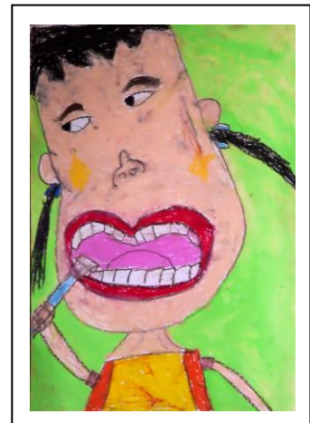
天領小 くろき のえる

大きく口を開いて、歯みがきをしっかりしている自分を画面いっぱいに大きく生きいきと描いている小学校2年生らしい作品です。